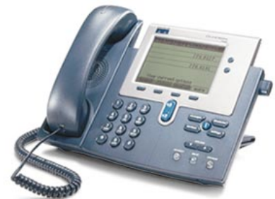
Figure 1 Téléphone IP Cisco 7940

Le téléphone IP Cisco est un dispositif de communications normalisé. Le téléphone IP Cisco 7940 est un téléphone IP multi-fonction de seconde génération destiné aux utilisateurs dont le trafic est lent à moyen et qui exigent un minimum de numéros d'annuaire. Il est doté de deux boutons de ligne et de fonction programmables, capables de gérer quatre appels simultanément, et de quatre touches interactives qui guident l'utilisateur pour les fonctions d'appel. Il comporte également un grand écran à cristaux liquides. Cet écran permet l'affichage d'informations telles que l'heure et la date, le nom de l'appelant, son numéro de téléphone et les numéros composés. Ses possibilités graphiques permettent l'intégration de fonctions actuelles et futures.